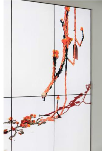
Ian Cheng Bag Of Beliefs (BOB) artificial lifeform, 2018 Serpentine Gallery, London

1984年、ロサンゼルス生まれ。 現在はニューヨークを拠点に活動。 モーションキャプチャーなど最先端のアニメ技術を使い、人工的に作られた事物が異種混合的に絡み合う映像作品を制作している。 近年の個展として、2018年サーペンタイン・ギャラリー(ロンドン)、2017年Moma PS1、2015年サンドレット・レ・レバウデンゴ財団現代美術館(トリノ)、デュッセルドルフ美術館(デュッセルドルフ)、2014年ミラノトリエンナーレ(ミラノ)などがある。 主なグループ展として2017年横浜トリエンナーレ、2016年リバプール・ビエンナーレ、2015年パリ市立近代美術館(パリ)、オルブライト=ノックス美術館(アメリカ合衆国)、2014年台北ビエンナーレ(台北)、2013年リヨンビエンナーレ(リヨン)、Moma PS1(ニューヨーク)、2012年スカulptureセンター(ニューヨーク)など多数。