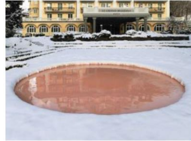
Pamela Rosenkranz Skin Pool, 2014

近年参加した主なグループ展として、2017年ルイジアナ美術館（コペンハーゲン）、マイン美術館（ドイツ）、2014年カルマインターナショナル（スイス）、2013年ヴァルト（ベルリン）、2008年のベルリンビエンナーレ、マニフェスタ7（イタリア）など多数。