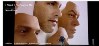
Glass Bead's website homepage

芸術、科学、哲学といった複数の学術的、実践的、政治的な交差を考えるリサーチ・プラットフォーム。アーティスト、歴史家、理論家により構成されている。 パリとロンドンを拠点に活動。 オンライン上で記事を公開している他、本の出版、レクチャー、ワークショップなどを行う。メンバーにはファビアン・ジローが含まれている。