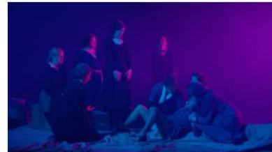
Fabien Giraud - Raphaël Siboni 1922 - The Uncomputable The Unmanned Season 1, Episode 4, HD video, 26 mn, 2016 © Fabien Giraud & Raphaël Siboni

ファビアン・ジロー(1980年生まれ)とラファエル・シボニー(1981年生まれ)により結成。2007年よりパリを拠点に活動。 ドキュメンタリー、映画史、哲学、技術史を引用した作品制作を行う。 近年の個展として、2009年ガートルート・コンテンポラリーアートスペース(メルボルン)、2007年にパレ・ド・トーキョー(パリ)などがある。 近年参加した主なグループ展として、2017年リバプールビエンナーレ、2015年パラッツォ・リーゾ美術館(イタリア)、2011年コペンハーゲン国際ドキュメンタリー映画祭(コペンハーゲン)、2009年モスクワビエンナーレ(モスクワ)など多数。